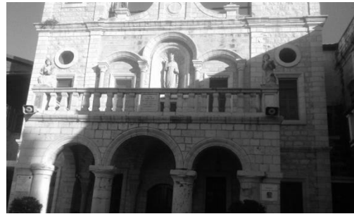
Gambar Gereja yang dibangun di atas Rumah Pesta di Kana

Mukjizat pertama yang dilakukan Tuhan Yesus adalah memenuhi kebutuhan memenuhi kebutuhan keluarga, rumah tangga yakni mengubah air menjadi anggur. Hal ini terjadi di kota Kana (Yoh. 2). Gambar berikut adalah gereja yang berdiri di Kfar Kana (kota Kana) mengingatkan para penunjang akan mukjizat pertama tersebut. Gereja ini dibangun di atas reruntuhan kuno, termasuk tempat peribadatan Kristen di masa-masa awal.