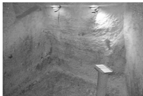
Penjara tempat Tuhan Yesus bermalam sebelum disalib

tempat Yesus disiksa, bukit Golgota, kuburan Yesus dan tempat Yesus terangkat ke Surga. Semua itu menjadi bukti bahwa Yesus pernah hadir di situ dan menyelesaikan tugas akhir hidup di bumi sebelum pergi kembali ke Surga.