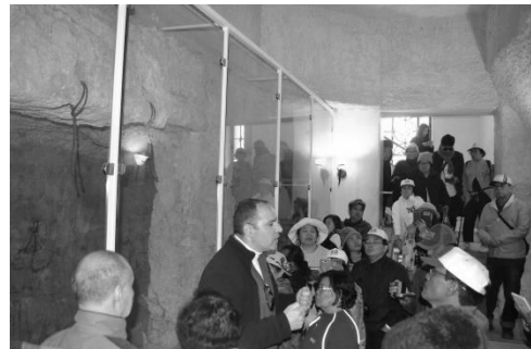
Tali tempat Yesus disiksa dan dicambuk