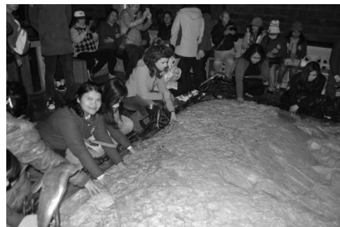
Gambar batu di taman Getsemani yang diyakini tempat Yesus berdoa sebelum mati di kayu salib.