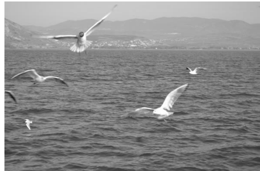
Gambar Danau Galilea