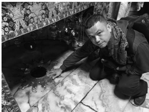
Gambar Tempat Kelahiran Yesus yang ditandai dengan bintang bersudut empat belas

Peneliti yang pernah mengunjungi kota Betlehem, menjelaskan melalui gambar tempat Yesus Kristus lahir di bumi. Kalau dulu Yesus Kristus lahir di kandang domba yang hina, saat ini tempat tersebut telah dipugar menjadi Gereja Kelahiran.