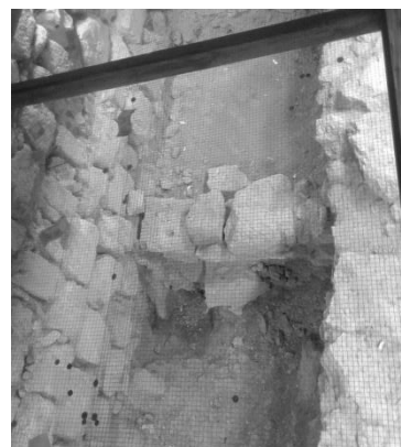
Gambar Reruntuhan Rumah Pesta di Kana