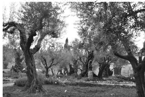
Gambar Taman Getsemani

Pemimpin dan pelayan Kristen masa kini harus bisa mengevaluasi dirinya masing-masing, apakah sudah menjaga hubungan dengan Bapa di Surga, atau malah