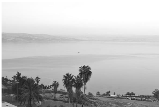
Danau Galilea dilihat dari Tiberias

dilakukan di sekitar danau Galilea. Terkait dengan kebutuhan membayar pajak kepada pemerintah, Tuhan Yesus membayar pajak dari mulut ikan yang ada di danau Galilea (Mat. 17:27). Terkait dengan kebutuhan kerohanian, di danau Galilea juga Tuhan Yesus mengajarkan banyak hal perumpamaan kepada banyak orang sehingga mereka dapat mengerti kebenaran-keberanan Kerajaan Surga (Mark. 4:1-2). Terkait kebutuhan manusia untuk mengatasi alam semesta, ketakutan dan sakit penyakit, Tuhan Yesus meredakan angin ribut, berjalan di atas air Danau Galilea, dan menyembuhkan semua orang sakit di Genesaret, tepi Danau Galilea (Mat. 14:32-36).