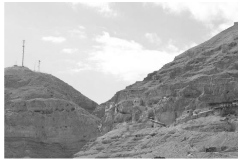
Gambar Bukit Pencobaan

dengan Bapa di Surga. Dan di bukit Getsemani banyak ditanam pohon ara, bahkan ada pohon ara yang sudah berumur lebih dari 2000 tahun.