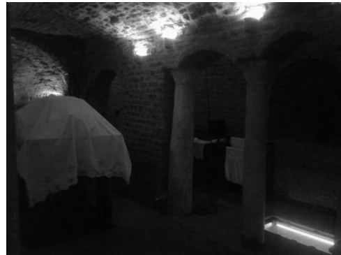
Gambar sumur dan Rumah Kudus di Kairo, Mesir.