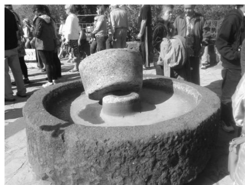
Tempat Pembuatan Anggur

Tuhan Yesus memenuhi kebutuhan manusia dengan melakukan berbagai mukjizat dan kebanyakan mukjizat tersebut